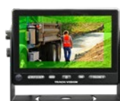
Zone 1 Détection éloignée

La capacité du système à ne détecter que l'approche d'un objet à partir du capteur radar permet de limiter le nombre de fausses détections causées par des objets sans importance qui se trouvent dans la zone de détection. Le système à usage industriel est étanche selon la norme IP69K et fonctionne parfaitement dans toutes les conditions météorologiques.