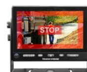
Zone 3 Détection rapprochée